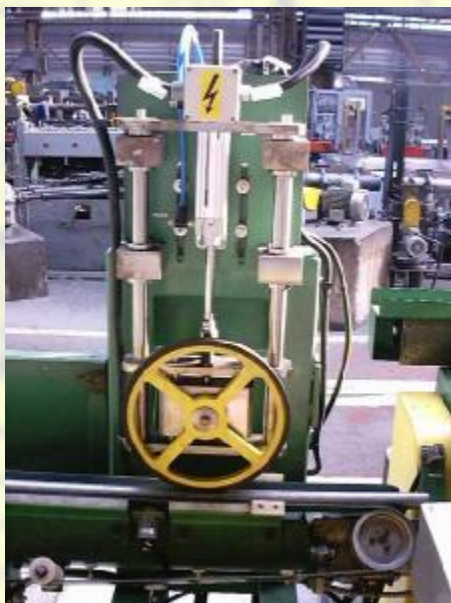
Dělicí linka REIKA