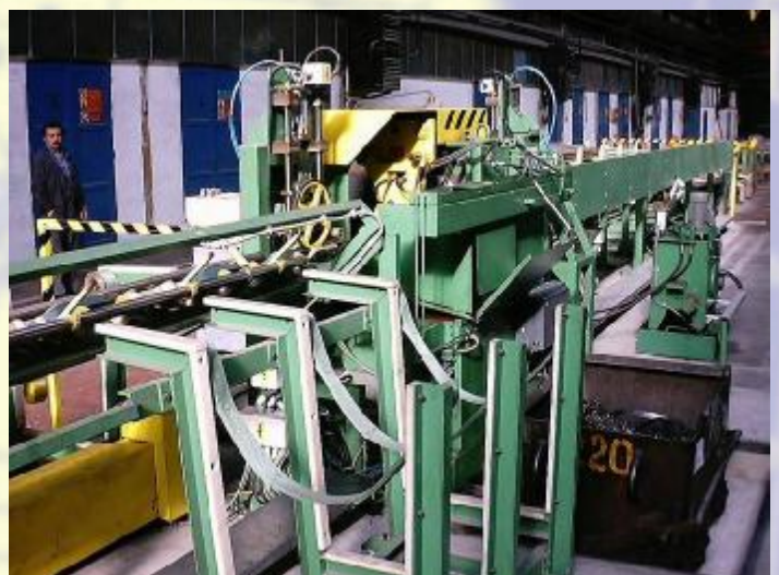
Dělicí linka REIKA