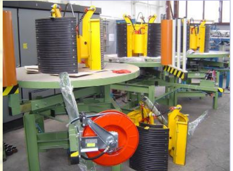
Odvíjecí stůl s přenašečem